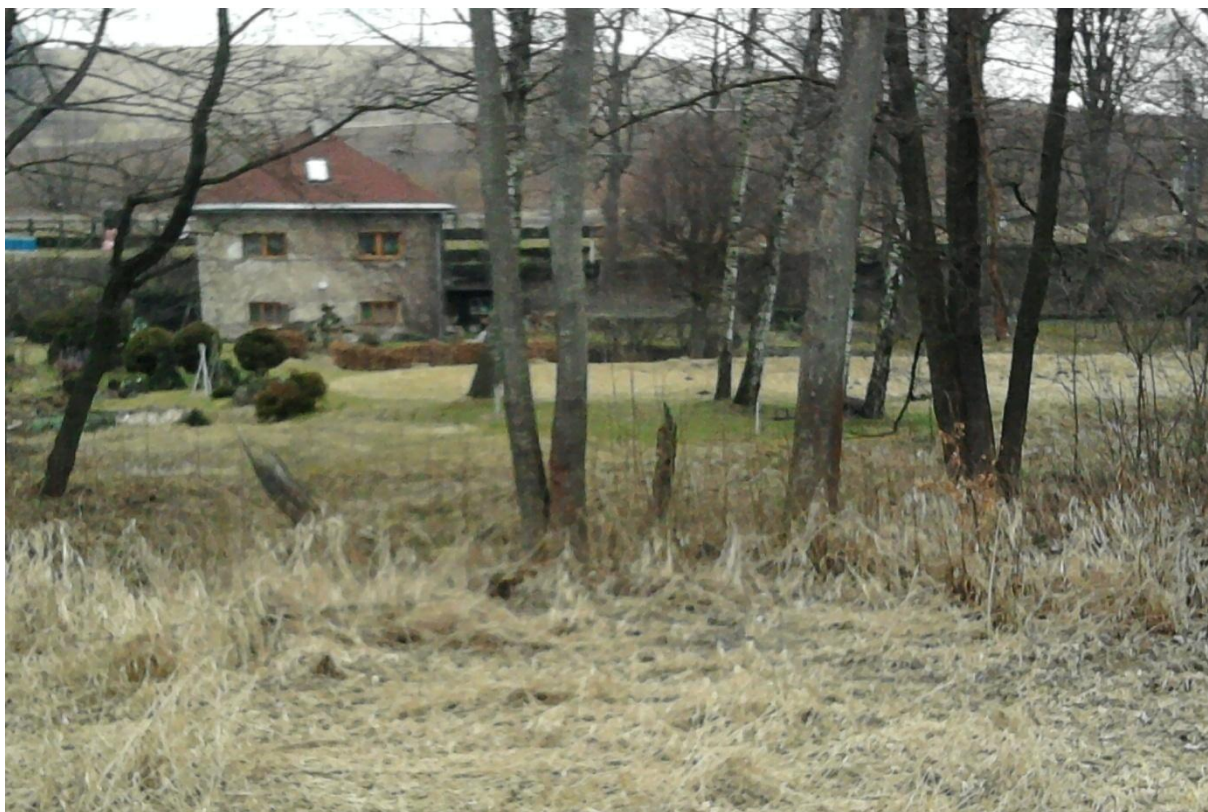
Současný stav-pohled od řeky