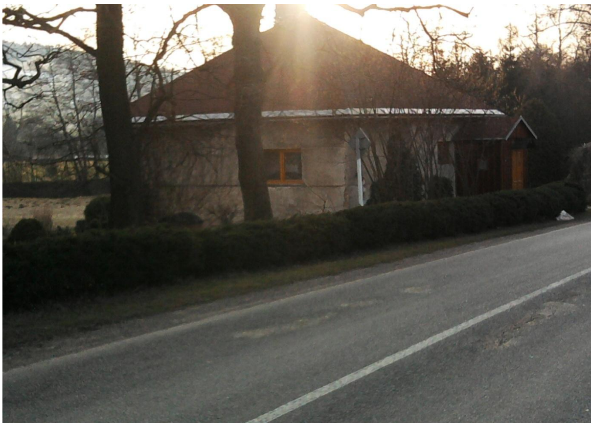
Současný stav-pohled od silnice