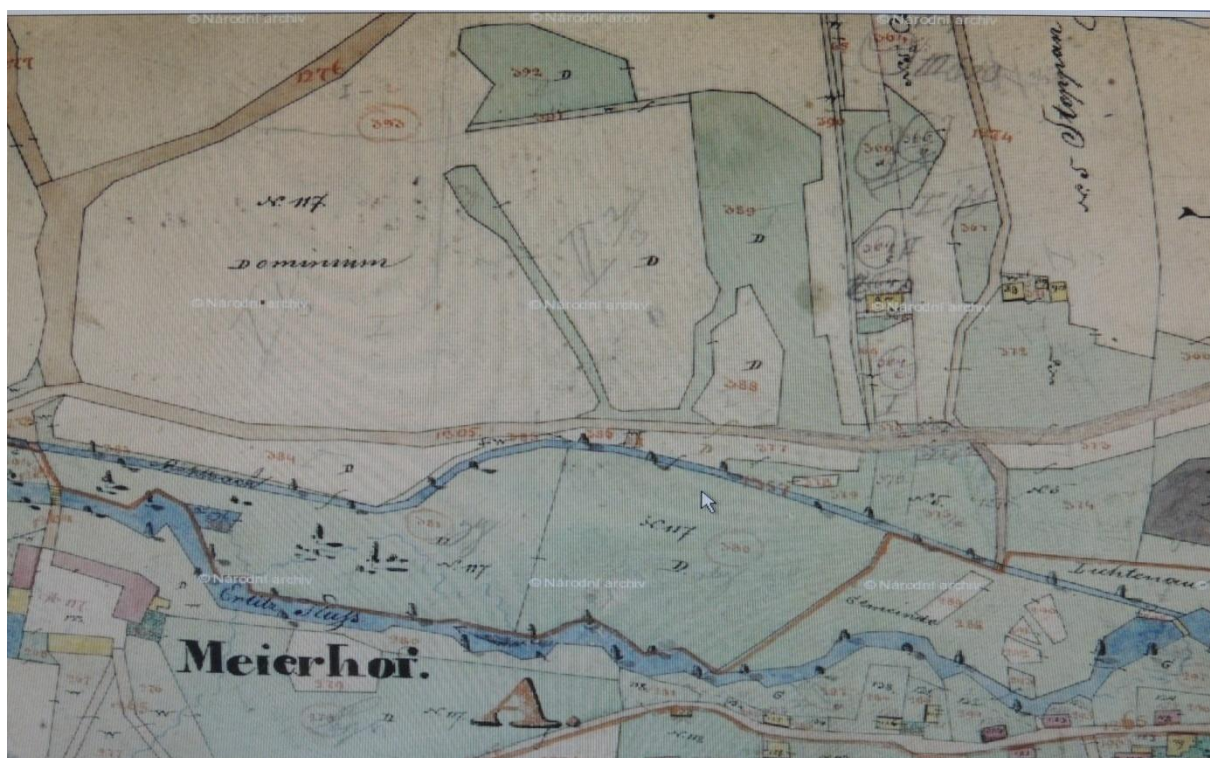
Náhon mlýna , stav okolo roku 1850 , vlevo dole je areál lichkovského dvora